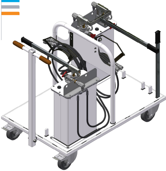
Separate unit TMH GA96-10-00 version Groupe séparé version TMH GA96-10-00